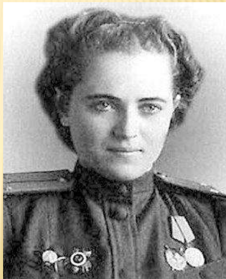
СРЕДНЯЯ ШКОЛА № 34 Г.ТИХОРЕЦКА