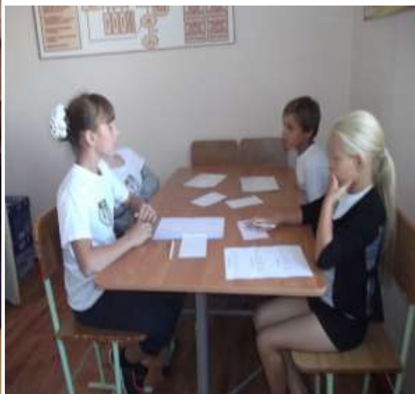
«Что такое толерантность?» бкласс