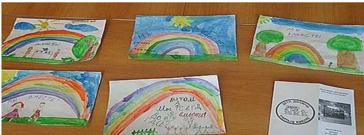
Занятие «Когда дух сильнее недуга» с ребенком инвалидом 8 класса обучающейся на дому