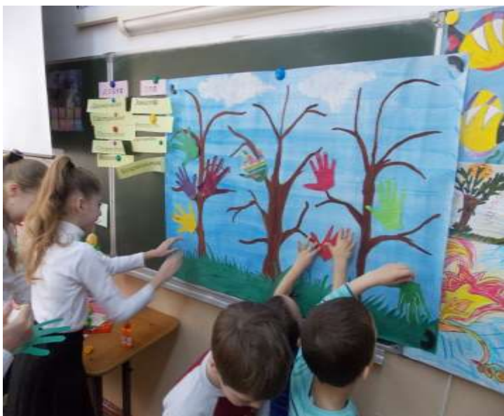
Конкурс рисунков «Дерево добра и доверия» 4 класс