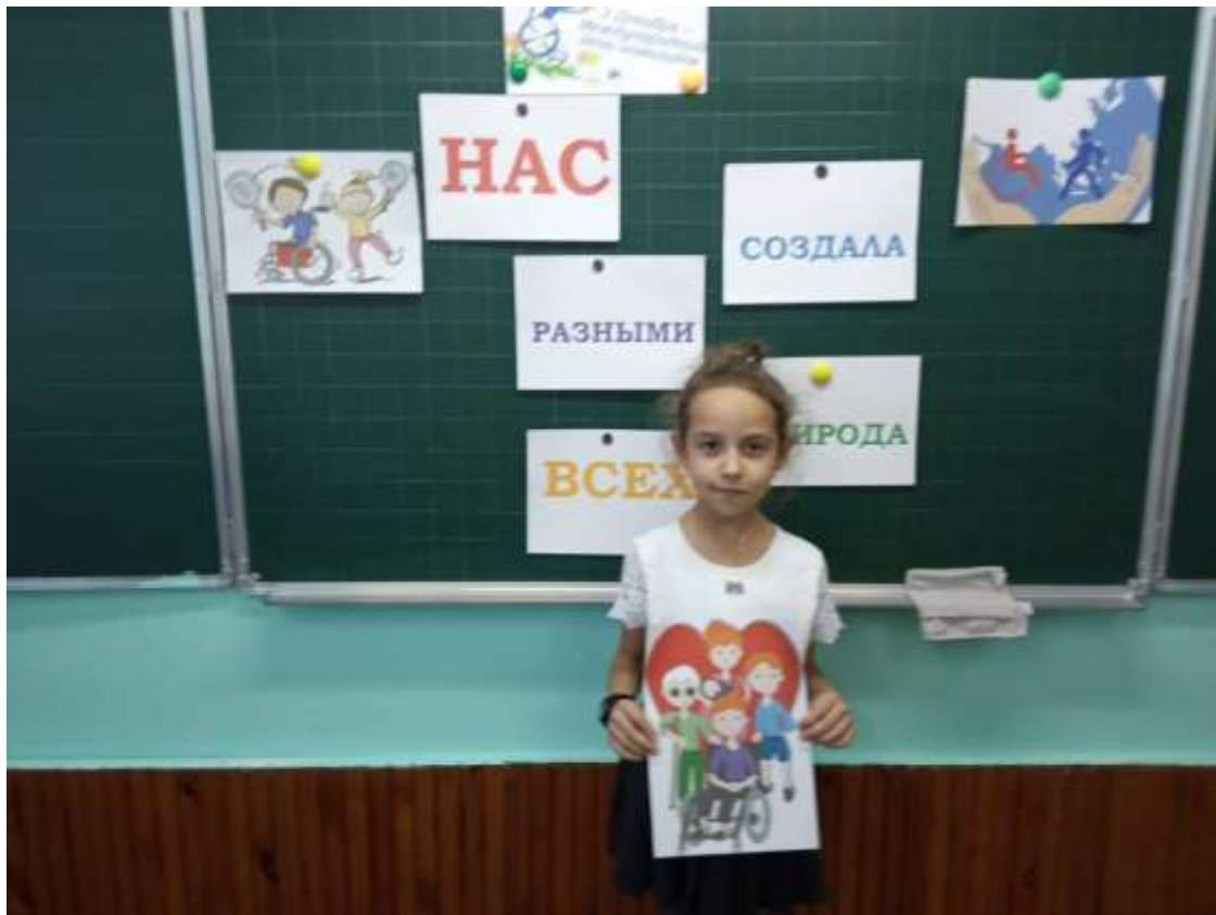
Круглый стол «Инклюзивное образование» приняли участие 8 классы