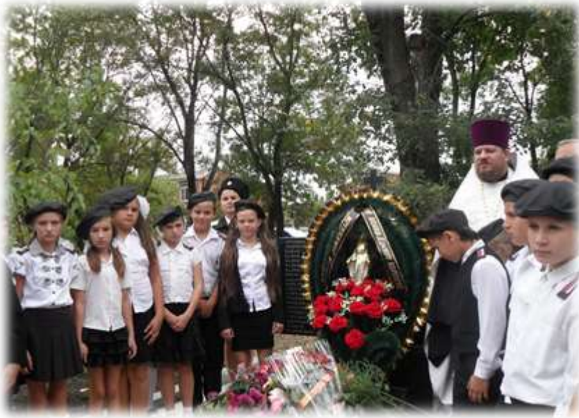
Наш класс присутствовал на освящении памятника.